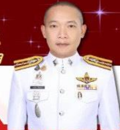
พล.ต.อ.ภาสกร หินเธาว์ ผกก.สภ.ธวัชบุรี